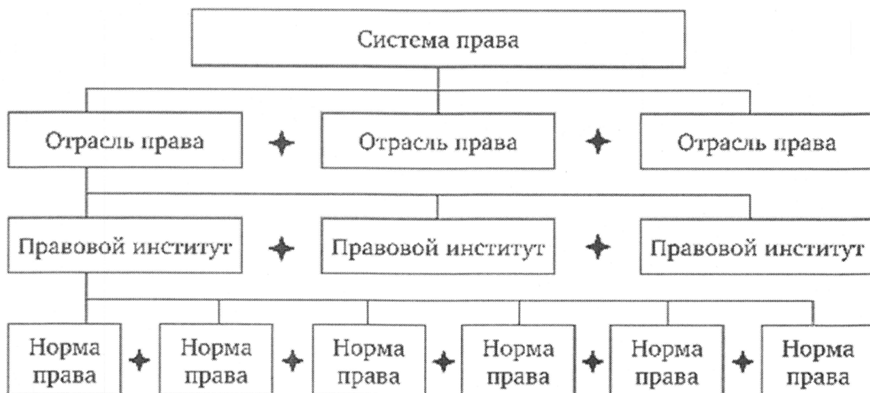
Рис. 16.1. Система права

Таким образом, «Право, кроме внешней формы, имеет и внутреннюю, под которой понимается его организация, способы образования как каждой отдельной нормы права, так и всех норм в единое целое, в систему (рис. 16.1).